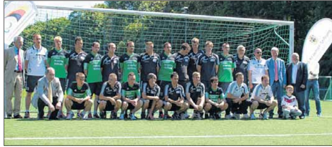
Die DBS-Nationalmannschaft freut sich auf die kommenden Herausforderungen in Brasilien.

Bevor sich das Team am 11. August nach Brasilien aufmacht, findet vom 3. - 10. August ein letzter Lehrgang in Forchheim statt. Das Ziel des Nationaltrainers ist es, das Niveau der letzten WM in