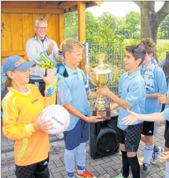
Die Kids der Schule Grönauer Baum durften am Ende des Turniers den großen Siegerpokal in die Höhe strecken.