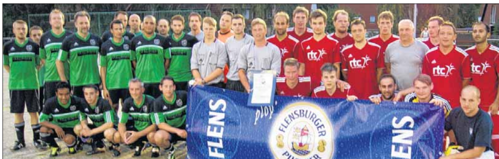
Die Mannschaften des SV Großhansdorf und der FSG Südstormarn III freuten sich nach der Partie auf das gemeinsame Flensburger Pilsener.

Am Dienstag kommt es in Güster zum absoluten Topspiel in der 1. Runde des FLENS CUP Meister