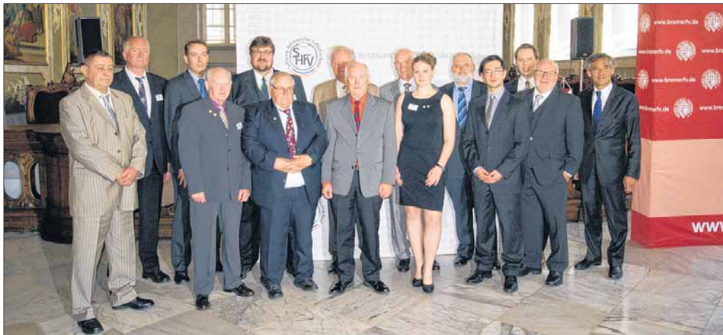
Die Ehrenamtspreisträger durften sich über ein erlebnisreiches Wochenende in Malente, Hamburg und Lübeck freuen.

Dabei steht weniger der sportliche Erfolg als der gesellschaftliche Nutzen im Vordergrund. Zur Auszeichnung können Personen vorgeschlagen werden, die entweder projektbezogen Bedeutendes geleistet oder aber feste Aufgaben und Ämter im Verein übernommen haben. Vielleicht wurde ein internationales Fußballturnier, ein Sommerferiencamp für Kinder und Jugendliche organisiert oder es gab besondere integrative Kooperationen zwischen Fußballabteilungen, Schulen und anderen