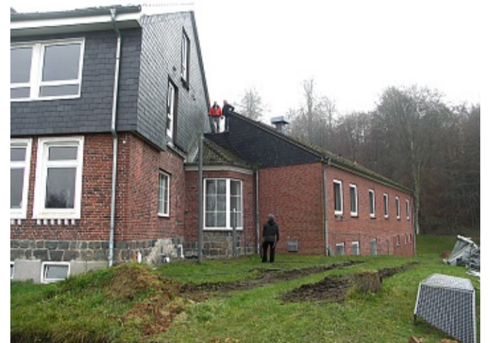
Der linke Trakt bleibt, der rechte soll weichen: An seiner Stelle entsteht das neue Gebäude, das sich auf Stelzen stehend über den Hang in Richtung Fußballplatz erstrecken soll (siehe Zeichnung oben).

Im Juni wurde gemeinsam mit Uwe Seeler, dessen Namen die Einrichtung einmal tragen soll, das Bauschild enthüllt. Die Finanzierung stand zu diesem Zeitpunkt zwar schon, doch an den Bauplänen musste noch gefeilt werden, weshalb sich der Baubeginn bis gestern hinausgezögerte. In dieser Zeit stiegen die Baukosten geringfügig um 35 000 auf nun 3,75 Millionen Euro. Ursprünglich sollten 1,385 Millionen